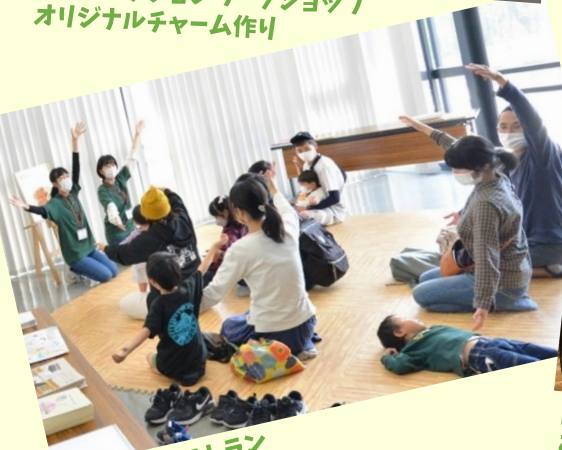
おはなしレストラン