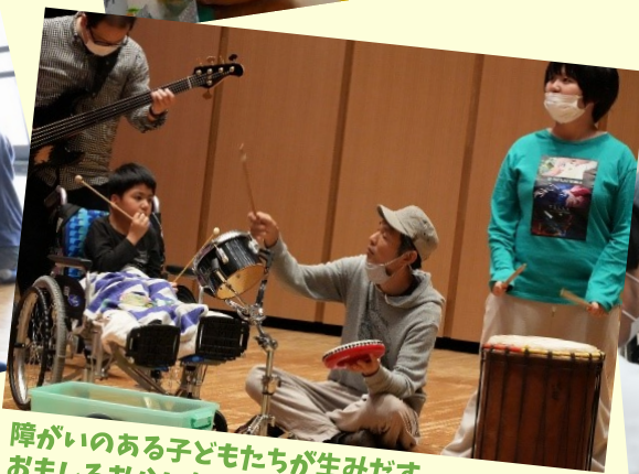
障がいのある子どもたちが生み出す おもしろおかしい音楽体験ワークショップ