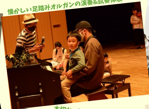
懐かしい足踏みオルガンの演奏&試奏体験