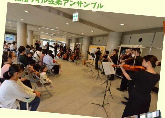
山陰フィル弦楽アンサンブル