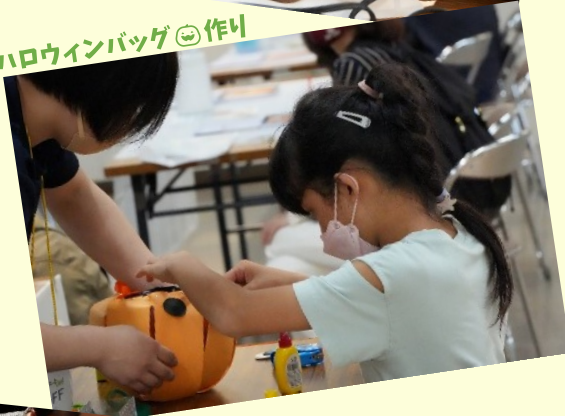
ハロウィンバッグ🍵作り