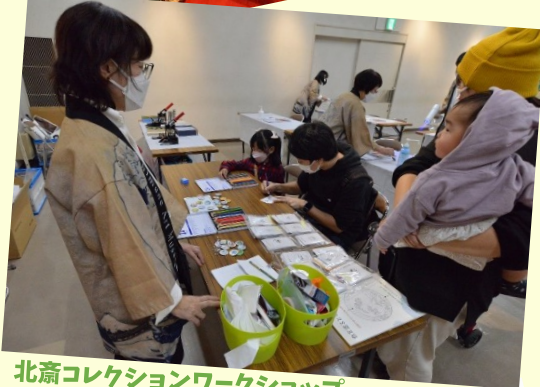
北斎コレクションワークショップ オリジナルチャーム作り