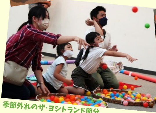
季節外れのザ・ヨシランド節分