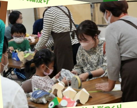
おさんぽカメさん&パクパク人形づくり