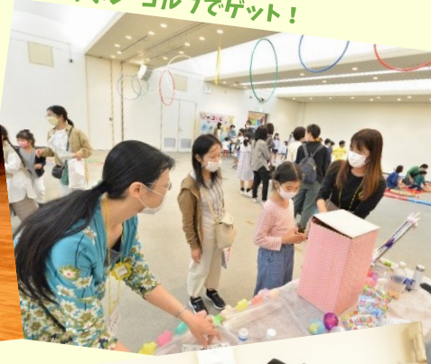
ガチャポン・ゴルフでゲット!