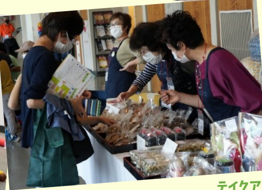
テイクアウトコーナー