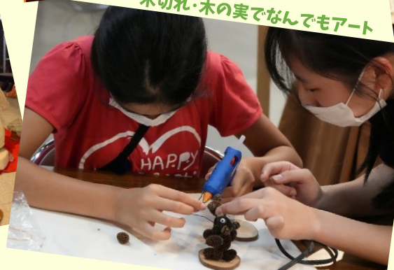
木切れ・木の実でなんでもアート