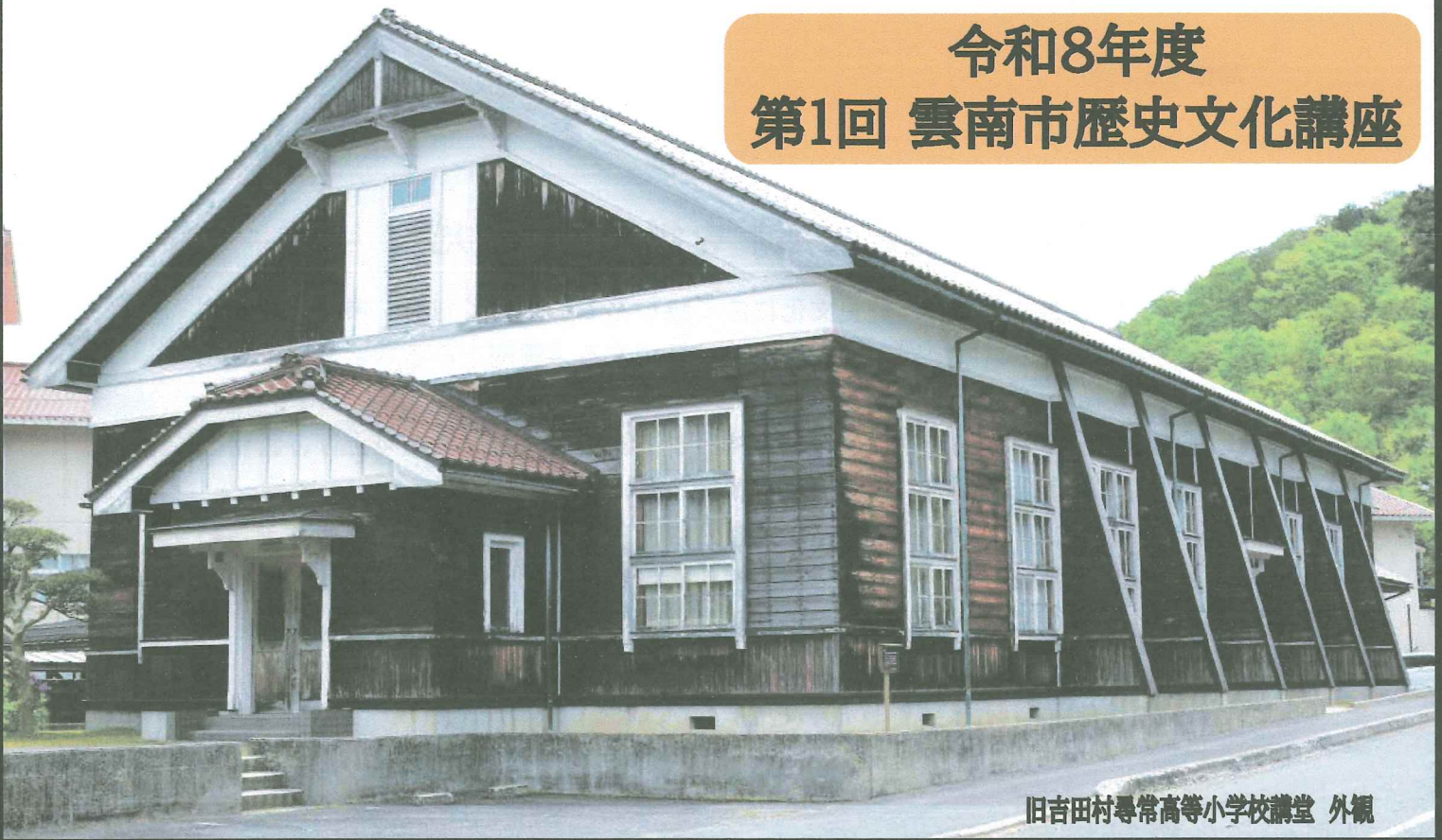
旧吉田村尋常高等小学校講堂 外観