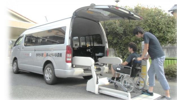
障がい者施設へ車いすのまま乗れる車を。