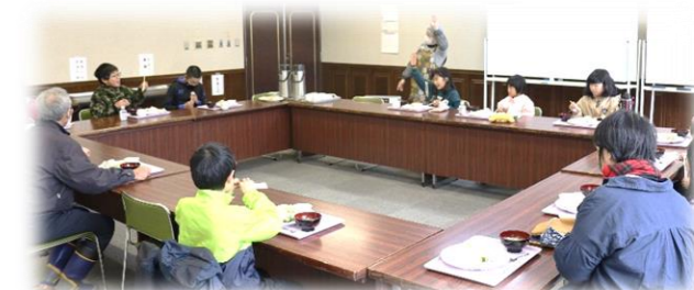
子ども食堂の支援。