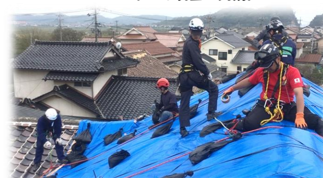
災害時のボランティアセンターの運営等に。