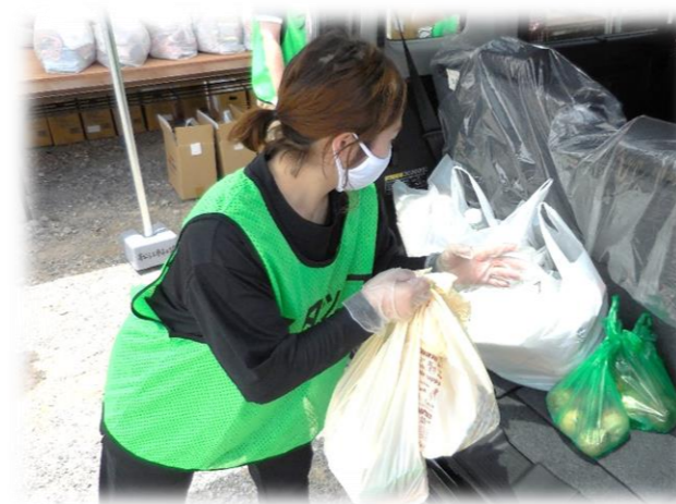
コロナ感染下のひとり親家庭への支援に。 (食品などの物品提供活動)