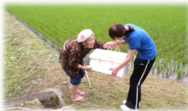
高齢者の方に買い物の宅配サービス。