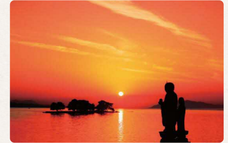
「宍道湖の夕日」 (島根県松江市)