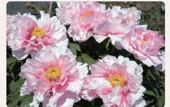
「大根島のぼたん」 (島根県松江市)