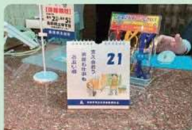
男女共同参画推進標語の日めくりカレンダー 2024年度/つらーて浜田「浜田市男女共同参画研究会」