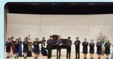
プロのソプラノ歌手と合唱部に所属する 高校生たちとのジョイント歌曲コンサート 2024年度/アンサンブル・デュアリテ