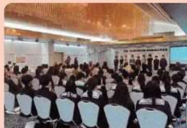
地球温暖化防止のための活動発表および専門家による講演会 2024年度/しまねエコライフサポーター出張支部