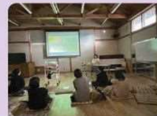
妊娠中、子育て中の女性を対象にした トークイベント 2024年度/mamaim