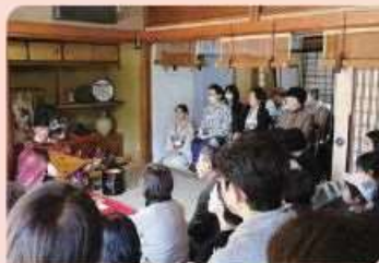
古民家カフェを会場にした伝統楽器の演奏会と 出店形式のショップ開催 2024年度/日本の伝統文化を再発見する会