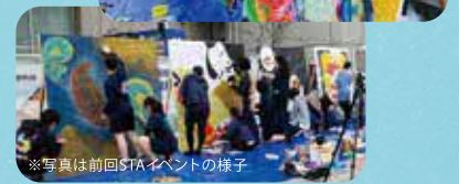
※写真は前回STAイベントの様子

THANK YOU! メッセージボードに旧庁舎の思い出や感謝の気持ちを書き込んでください!