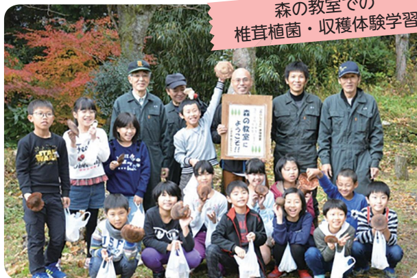
森の教室での 椎茸植菌・収穫体験学習