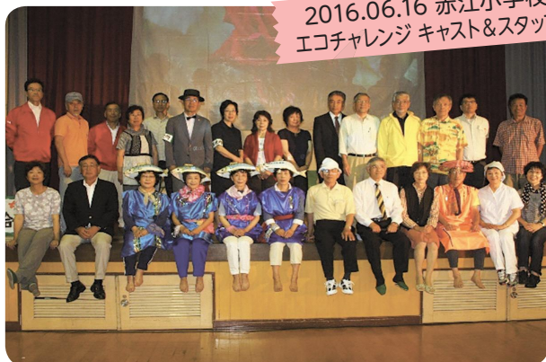
2016.06.16 赤江小学校 エコチャレンジキャスト&スタッフ