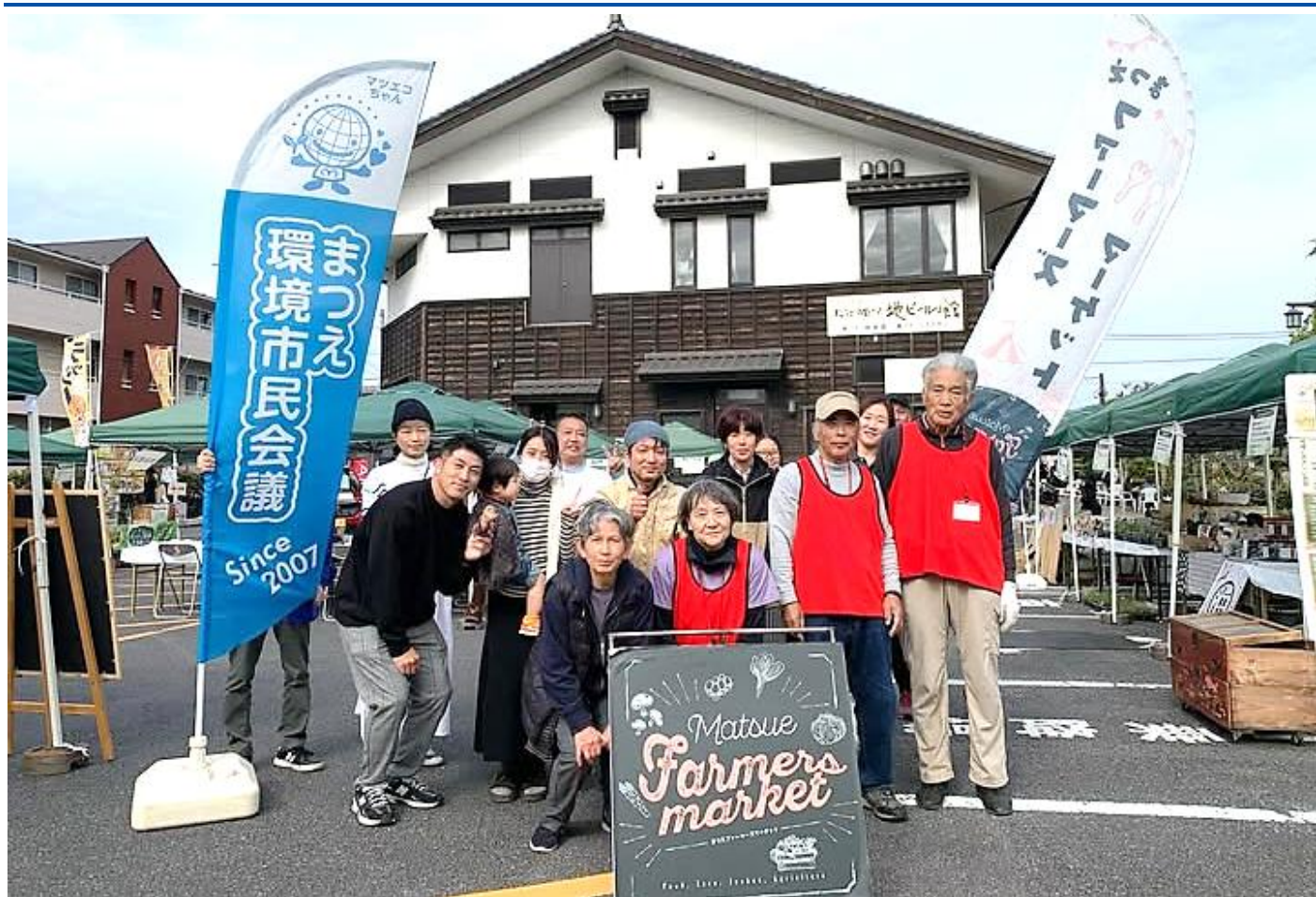
ファーマーズマーケット in 堀川遊覧船ふれあい広場 参加者