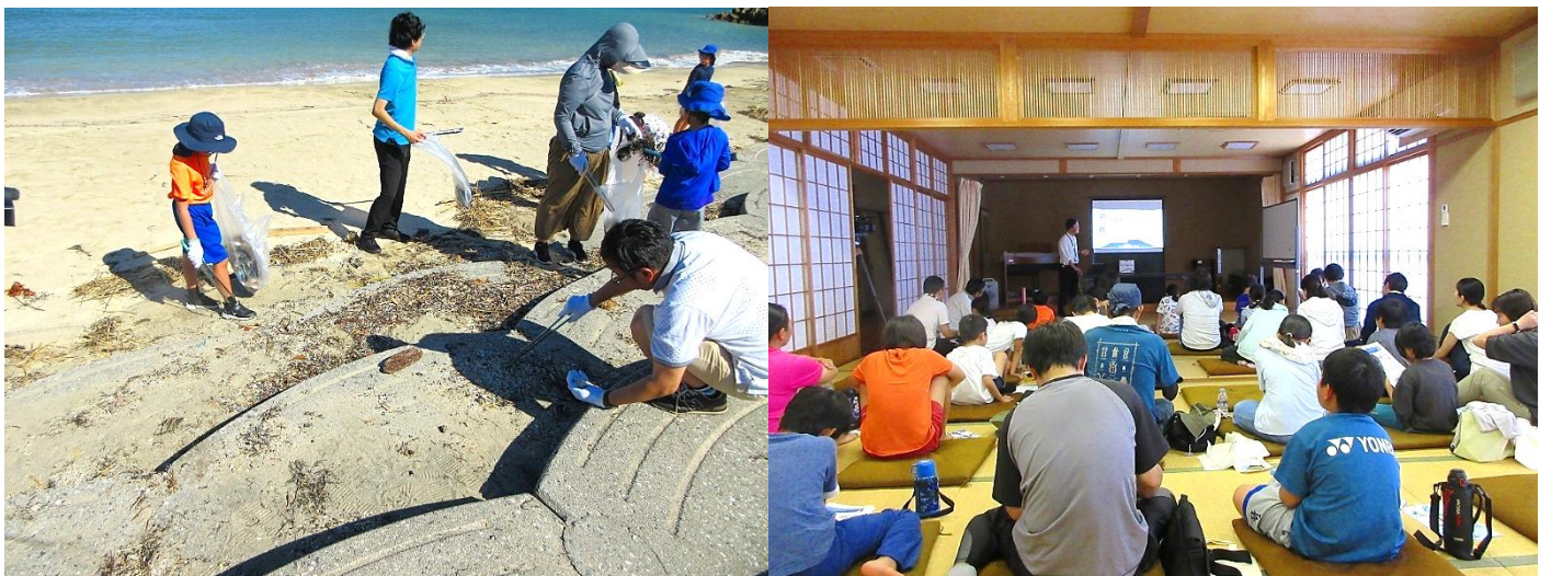
ごみの回収状況と、作業後の学習会