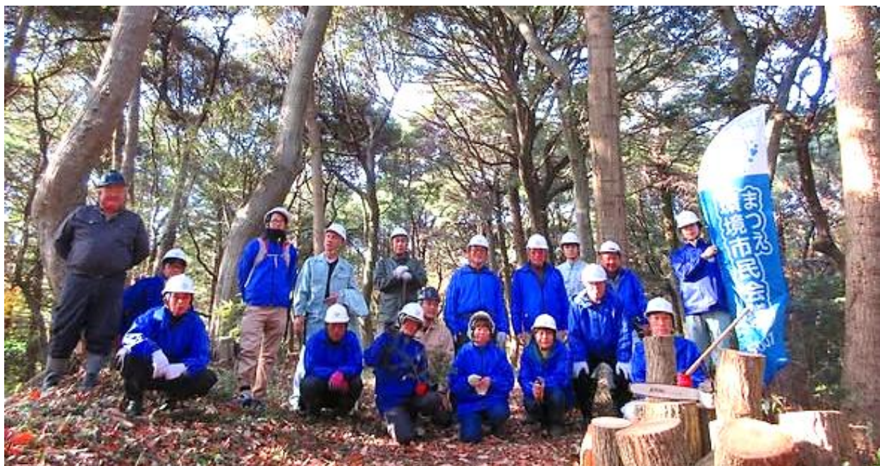
参加者（2025.12.13 - 2回目）