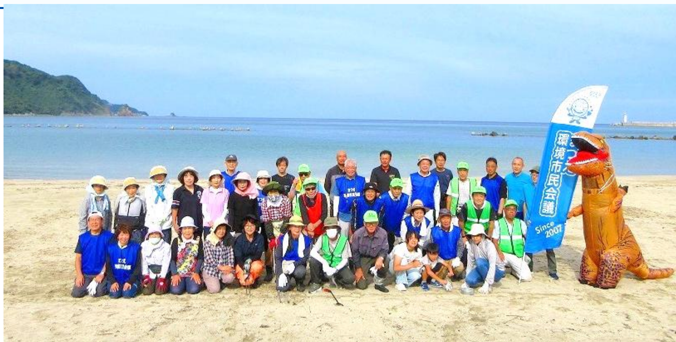
古浦海岸漂着ごみ回収作業 参加者