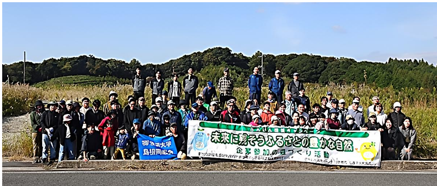
参加者（主催者発表 93 名）