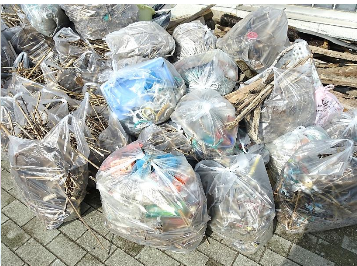
回収された漂着ごみ（プラごみがいっぱい）