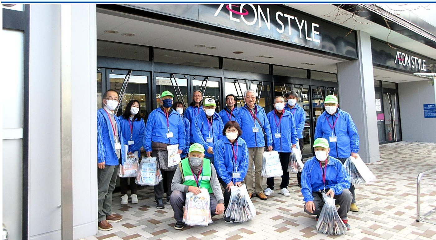
デコ活 食品ロス削減の啓発活動 @ イオン松江店 参加者