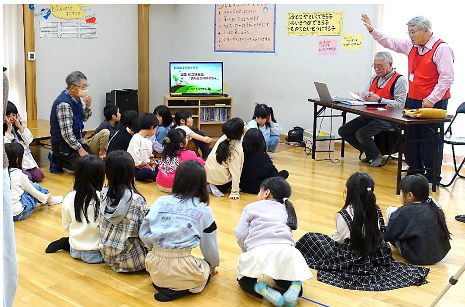
原作者 山口信夫氏のお話を聞く子どもたち