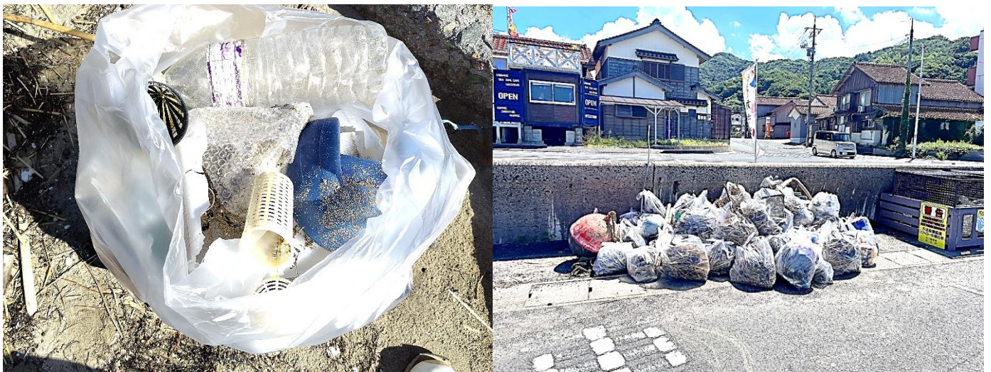
プラごみがいっぱい（集まった漂着ごみ 約 80 袋）