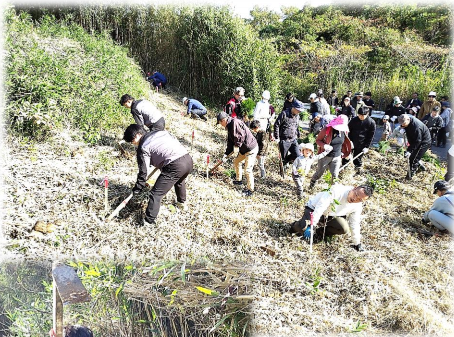
急斜面での植林活動