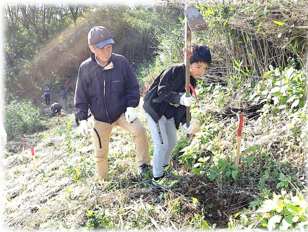
成山さんとお孫さん