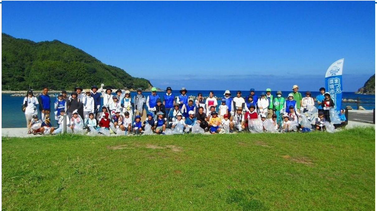
海ごみゼロ大作戦 in 野波海岸 参加者