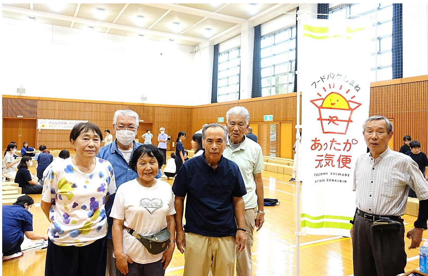
2025.08.19 フードバンクしまね あったか元気便 パッキング作業 参加者