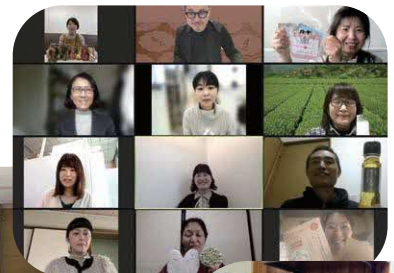
オンライン 受講風景

なお、 中山間地域に主たる事業所がある法人、団体または住所がある個人が対象です。