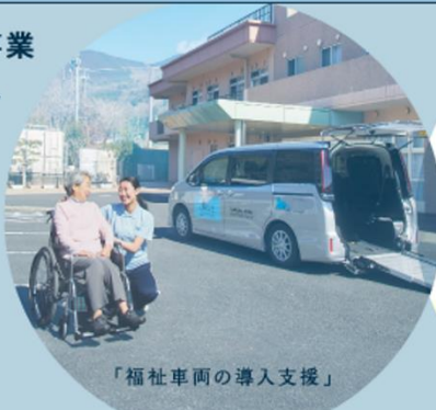
「福祉車両の導入支援」