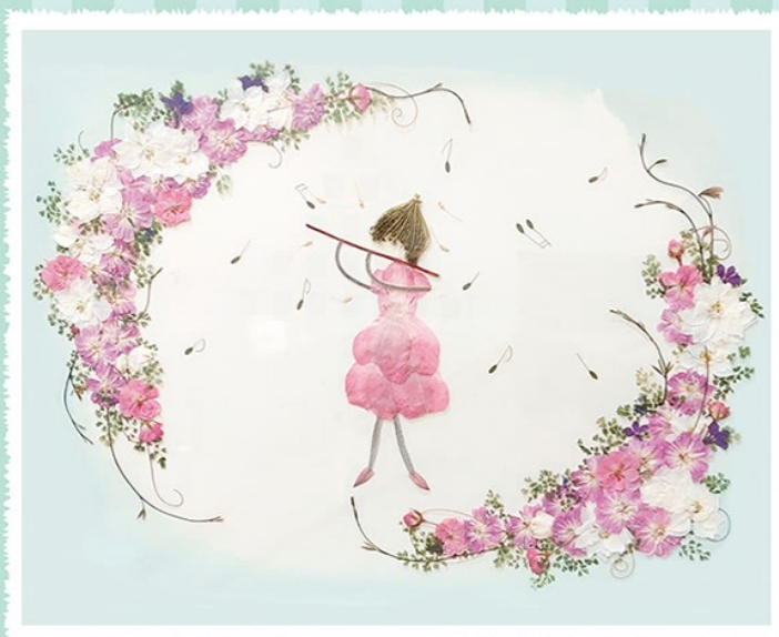
〈笛を吹く少女〉 Oshibana Group