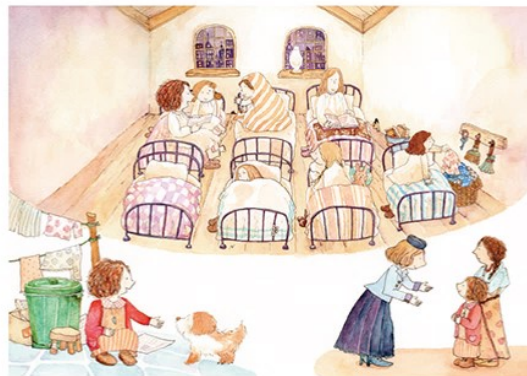
2021 ミュージカル「アニー」プログラム挿絵

1975年島根県生まれ。2001年よりイラスト、自作絵本の展示活動を始め。飯南町に帰郷後、自宅まわりの草刈りを題材に制作した絵本「がまぐちがえるのつゆくさじむしょ」( '16 / フレーベル館)、月刊誌絵本「がまぐちがえるのたねあつめ」( '15 キンダーおはなしえほん 11月号)は、台湾・中国で翻訳刊行。水彩イラストを中心に、木工工作のワークショップでも活動中。