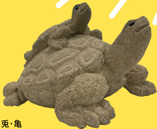
兎・亀 来待石製、当館蔵 いとうみちほ 伊藤暢保 作 (現代の名工)