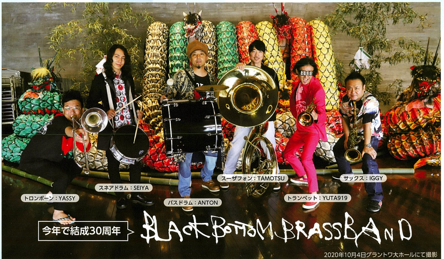
2020年10月4日グラントワ大ホールにて撮影