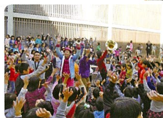
※コロナ前の写真です