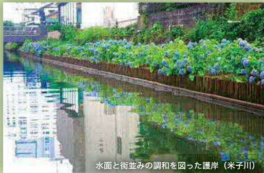
水面と街並みの調和を図った護岸（米子川）