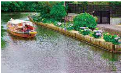
水面と街並みの調和を図った護岸(米子川)