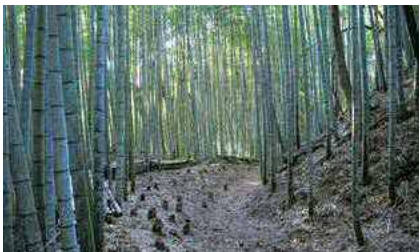
往還道(七曲がり道)整備