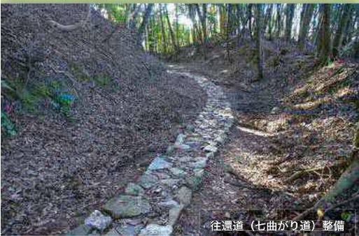
往還道（七曲がり道）整備