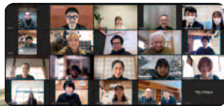
オンライン 受講風景

なお、 中山間地域に主たる事業所がある法人、団体または住所がある個人が対象です。