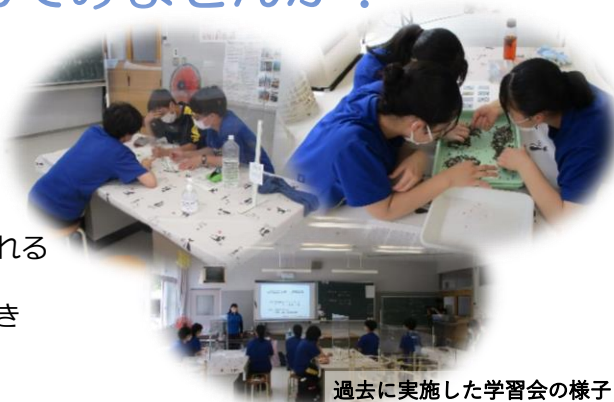
過去に実施した学習会の様子