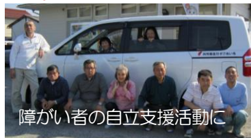
障がい者の自立支援活動に